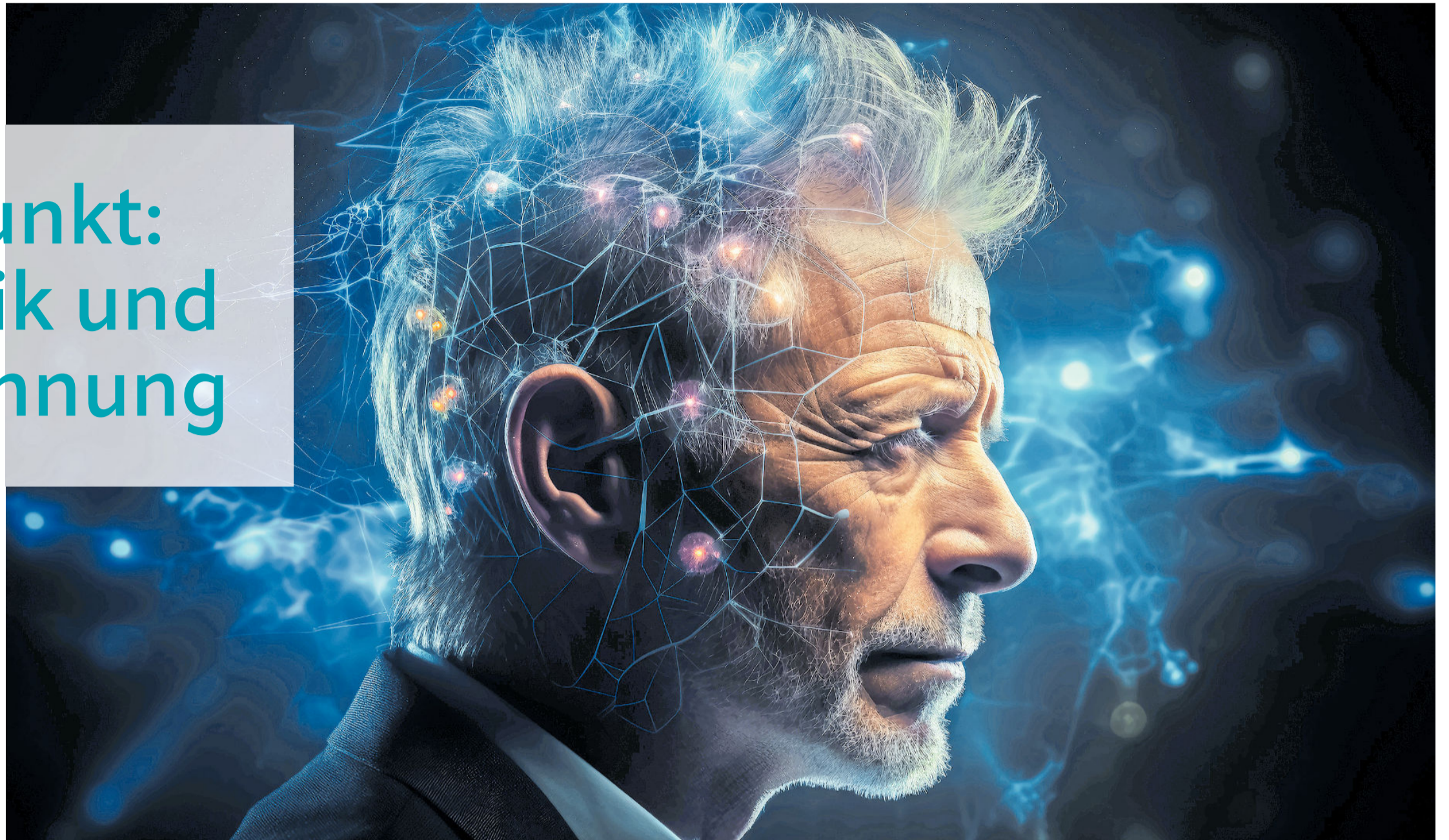
Parkinson ist eine tückische Krankheit, ihre Auslöser sind vielfältig, ihr Verlauf ist kaum vorhersehbar. Die neuen Leitlinien empfehlen eine umfangreiche Differenzialdiagnostik, um die Erkrankung frühestmöglich zu erkennen sowie eine frühzeitige, altersgerechte und individuelle Therapie.

Die neue Leitlinie zur Parkinson-Krankheit setzt gezielt jüngste Forschungsergebnisse um, so etwa zu den Ursachen von Parkinson oder zu nicht-motorischen Frühsymptomen