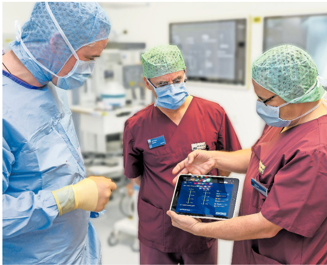
Neurochirurgen des LMU Klinikums beteiligen sich im Rahmen von Studien an der Entwicklung neuartiger Technologien, mit denen die Tiefe Hirnstimulation künftig besser auf die individuellen Bedürfnisse des Patienten abgestimmt werden könnte. Hier kontrollieren Ärzte die Aktivität des Schrittmachers auf dem Tablet.

Eine gut etablierte Therapie in fortgeschrittenen Krankheitsphasen ist die Tiefe Hirnstimulation, die eine Art „Herzschrittmacher“ für das Gehirn darstellt. Daneben gibt es auch sogenannte läsionelle Verfahren, zum Beispiel Gamma-Knife oder fokussierter Ultraschall, bei denen bestimmte Gehirnbereiche gezielt verödet werden können, ohne dass dazu ein operativer Eingriff nötig ist. Diese Verfahren werden jedoch bislang nur bei einer sehr kleinen Gruppe von Patienten eingesetzt, vor allem, wenn einseitiges Zittern im Vordergrund steht. Neue Therapieansätze, welche die Verzögerung des Fortschreitens der Krankheit zum Ziel haben, befinden sich aktuell in Entwicklung. Interview: Nicole Schaezler